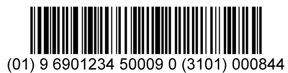
图 C.7 质量是 84.4 kg 的变量储运包装商品的 UCC/EAN-128 条码示例